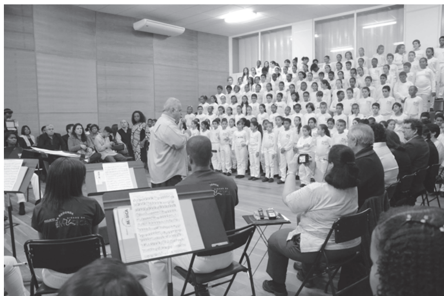
A sede do Projeto Cidade da Música fica na rua Graham Bell, Vila Mury

COMPLEXO – O complexo que abriga a nova sede do projeto Volta Redonda, Cidade da Música – que antes funcionava no Colégio Getúlio Vargas, da Fevre – inclui diversas salas de música e ensaio, com tratamento e isolamento acústico em todas as salas. A maior sala de ensaios, para a banda, orquestra, e sessões de música de câmara, pode receber um público de até 200 pessoas. As salas de ensaio vão atender grupos de diversos tamanhos, e incluem salas