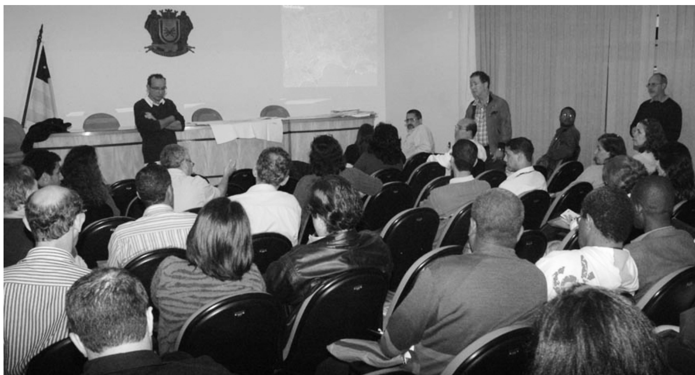
Censo 2010: A Comissão Municipal de Geografia e Estatística vai auxiliar os recenseadores na coleta de dados do município

O coordenador de Sub-área do Censo 2010, responsável por Volta Redonda, disse que todas as residências serão recenseadas e que o Instituto deverá realizar o concurso público para contratar os recenseadores a partir de março de 2010. A cidade de-