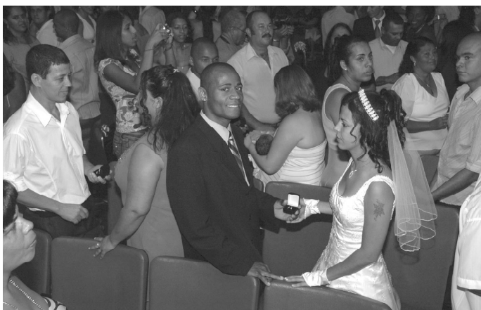
133 se casaram no sábado, dia 15, na Vila Santa Cecília