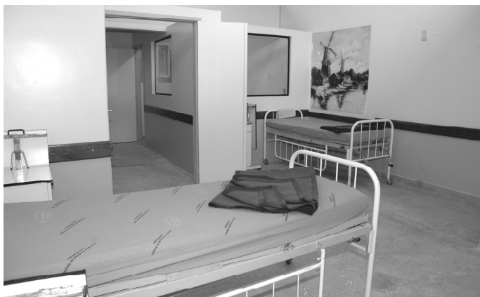
A enfermaria da Unidade Psiquiátrica de Urgência foi reformada

O s usuários do Cais – Centro de Assistência Intermediária em Saúde, do Aterrado receberam na terça-feira, dia 02 de setembro, as reformas e ampliações da enfermaria da