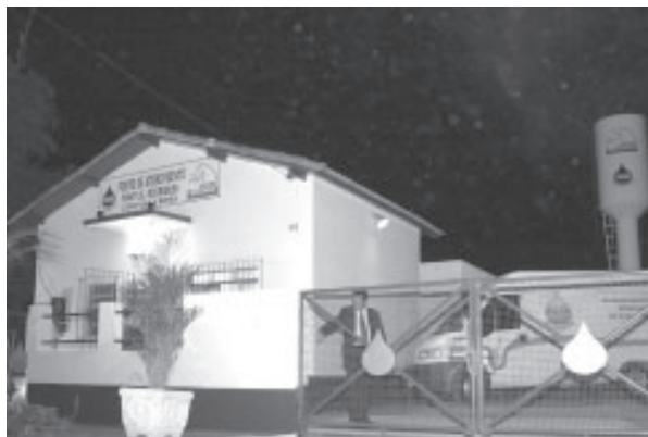
Posto: 2.500 pessoas serão beneficiadas com atendimento do SAAE-VR

Os moradores do Complexo Roma, que anteriormente eram abastecidos pela Cedae-RJ, ganharam um novo sistema de abastecimento de água