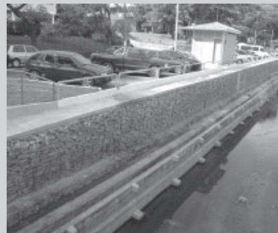
Cuidando: A recomposição das margens do córrego Brandão devolveu segurança ao trânsito e pedestres

O governo municipal devolveu aos moradores, pedestres e motoristas, a rua 41-C, na Vila Santa Cecília, totalmente recuperada. No ano passado, depois de ter cedido na maior parte da contenção às margens do córrego do Brandão, a administração fez uma licitação para uma obra de engenharia da recomposição das margens. Em onze meses de obras, entregou a rua no início da semana, totalmente recuperada. O investimento total foi de R$ 460 mil. A rua dá acesso ao antigo hospital da CSN, hoje Hospital Vita.