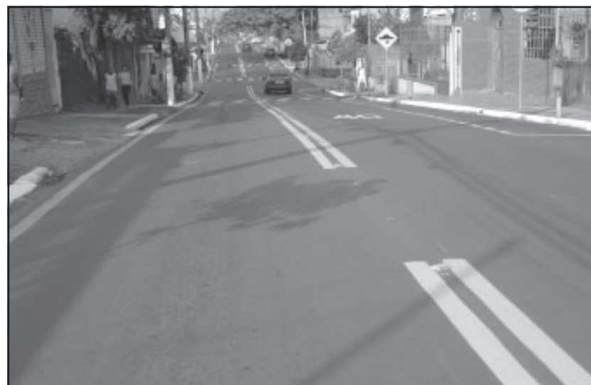
A principal via do Conforto recebeu sinalização vertical e horizontal.