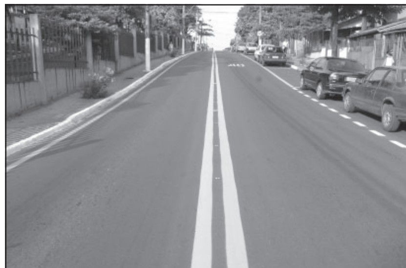
Novo asfalto da Rua 4 no Bairro Conforto.

Na quinta-feira, 27, a equipe da Secretaria de Obras inicia a manutenção do asfalto na rua 207. Na terça-feira, 24, o Governo Municipal entregou à população as obras de recapeamento asfáltico e sinalização da Rua 4, no bairro Conforto.