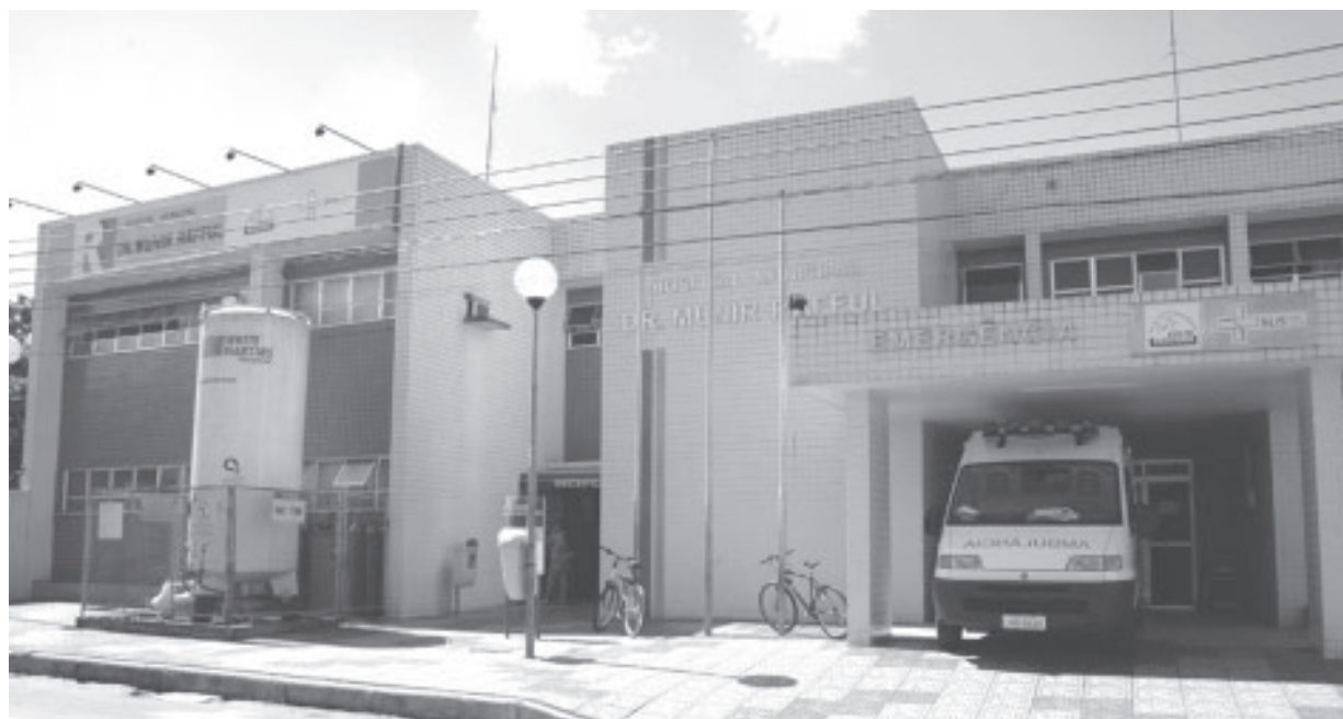
Médicos que trabalham nas emergências têm curso às segundas-feiras

O Governo Municipal, via Secretaria de Saúde, iniciou nesta segunda-feira (10/10) o 1º Curso de Emergência do Hospital Municipal Drº Munnir Rafful (HMR), direcionado aos médicos que atuam nas redes básica e de emergência do município (Unidades de Saúde, Hospital São João Batista, Hospital Municipal do Retiro, CAIS Aterrado e CAIS Conforto). O curso vai até o dia 19/12/2005, com aulas sempre às 2ª feiras de cada mês, das 19h30 às 22h, no Centro de Estudos "Munnir Rafful" do Hospital Municipal do Retiro. O objetivo é buscar o aperfeiçoamento e garantir sempre uma melhor qualidade no atendimento médico hospitalar da população, em casos especiais, de emergências, rotina diária vivida por esses profissionais da saúde pública.