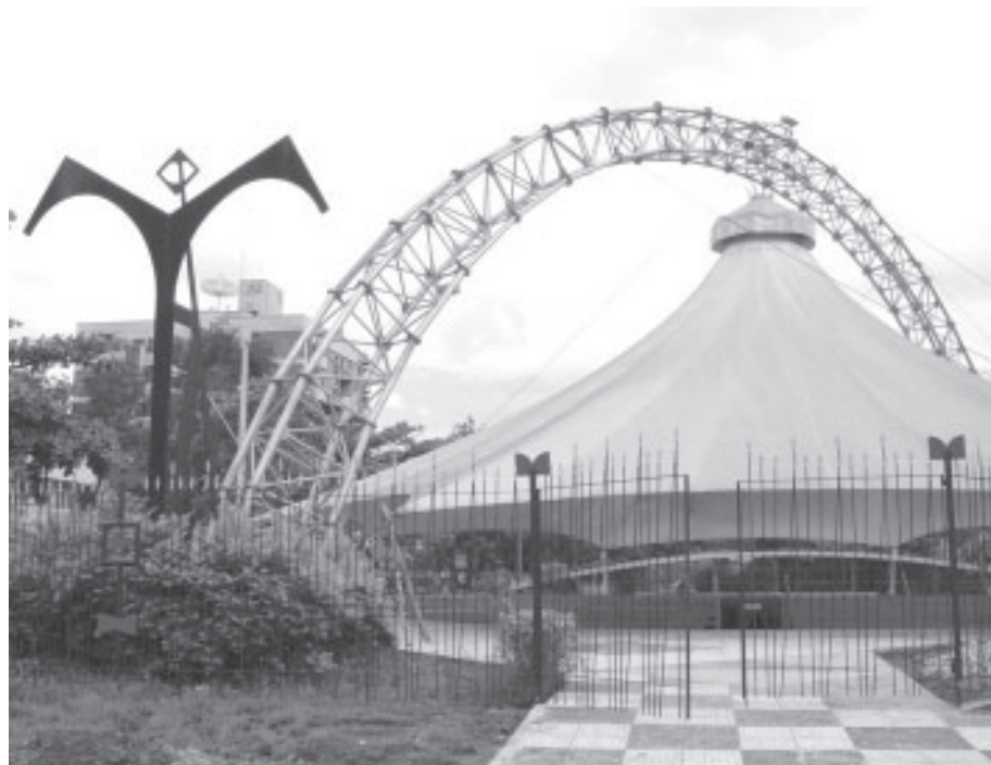
Monumento Zumbi dos Palmares, local das atividades

T eatro, shows musicais, danças, jongo, exposição de arte e máscaras. Estas e outras atividades estarão acontecendo nos dias 18, 19 e 20 de novembro, no Memorial Zumbi dos Palmares, Vila Santa Cecília, na comemoração pela Secretaria Municipal de Cultura, do “Dia da Consciência Negra”, para lembrar a luta do líder negro Zumbi dos Palmares pela libertação dos negros no país, contra a escravidão.