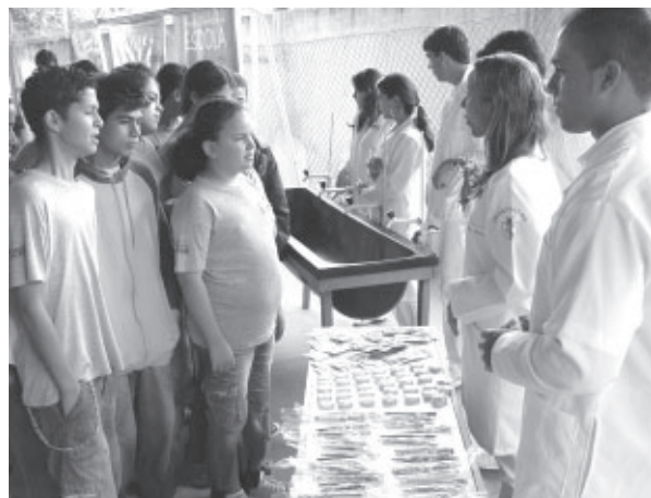
Saúde bucal: 50 mil crianças da rede municipal serão atendidas

O Governo Municipal apresentou na Escola Municipal Marizinha Félix, em Três Poços, no último dia 8, em parceria com o UniFoa, Drogaria Moderna e Fábrica Sanifil (produtos de higiene oral), o projeto Dentista na Escola: Dentes fortes, criança Feliz. O projeto tem como público alvo as escolas municipais, estaduais e particulares com atendimento na faixa etária de 3 a 15 anos, com a participação dos pais e o corpo docente das escolas, que receberão orientações adequadas sobre o projeto. A previsão de atendimento é de 50.000 crianças.