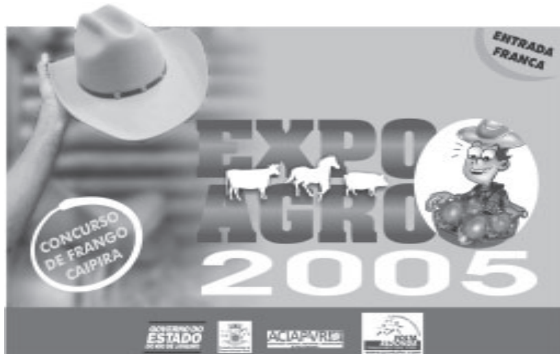
Entrada Franca: 1 a 5 de junho na Ilha São João