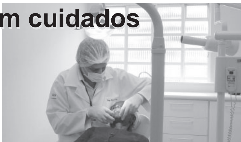
Gabinete Odontológico do Centro Dia atende em média 40 idosos