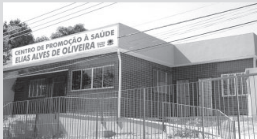
O Centro de Saúde Elias Oliveira atenderá a 3.500 moradores

A prefeitura de Volta Redonda entregou no dia 11 de setembro, o Centro de Promoção à Saúde Elias Alves de Oliveira, localizado na Rua Frei Henrique Soares, 183. O centro foi totalmente reformado e ampliado. A unidade de Saúde passou a contar com uma área de 285 m². Após ser reinaugurada, passou a prestar assistência a 3.500 moradores do bairro Jardim Cidade do Aço.