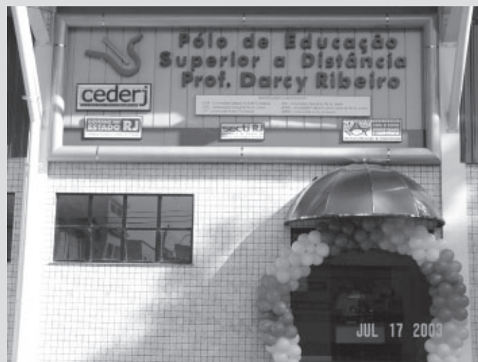
O objetivo é aumentar a oferta de cursos de graduação e extensão gratuitos à população

pré-vestibular. Estima-se que até o final do ano, mais de mil pessoas sejam atendidas pelo projeto. De acordo com educadores responsáveis pelo Cederj (Centro de Educação Superior à Distância do Estado do Rio), o fato de as aulas serem administradas por monitores de nada irá comprometer qualidade do ensino. O formando, segundo eles, assim que concluído o curso, recebe diploma de uma universidade pública, seja ela do estado ou federal.