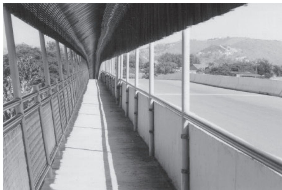
Flagrante da passarela de pedestres, coberta, do Viaduto Ponte Vila Americana-Aero Clube

D entro dos objetivos do Governo Municipal em levar qualidade de vida para a população, mais obras serão entregues de 1º a 14 de maio próximo, nos bairros do município. Confira a programação de entregas desses investimentos públicos.