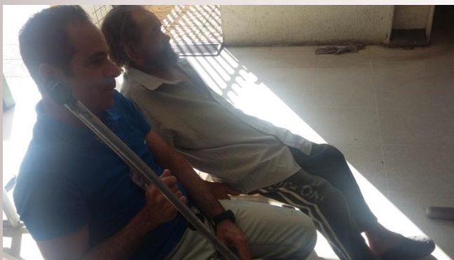
Aguardando Realização Exame TC- Crânio