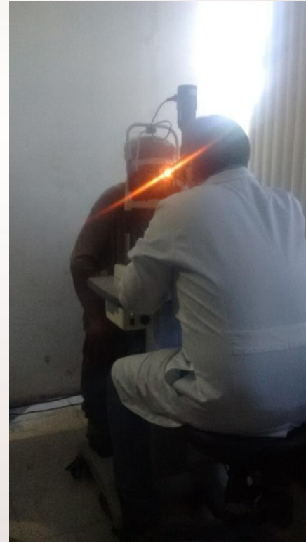
Consulta com oftalmologista