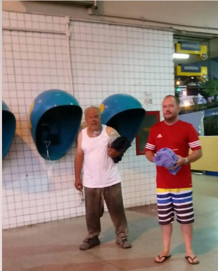
Banho na Rodoviária