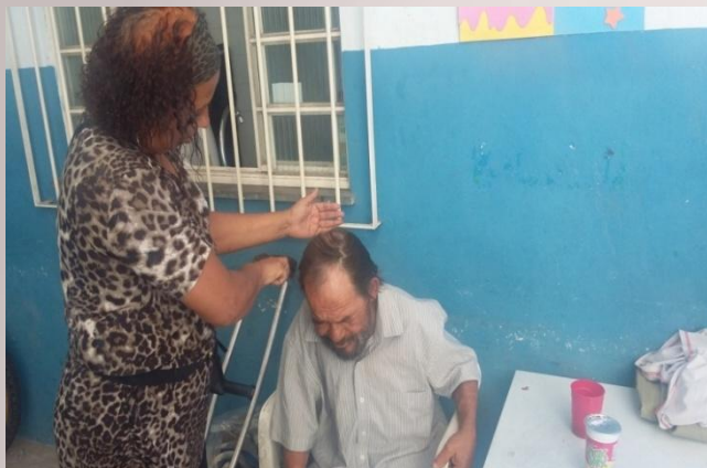
Banho no Centro POP