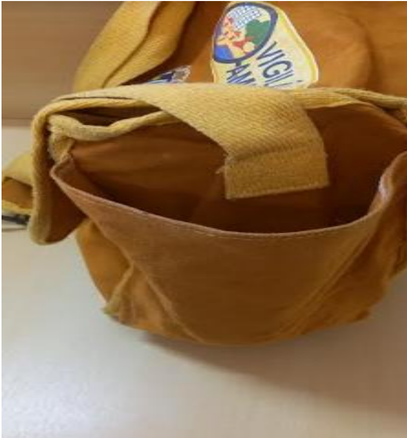
Bolso nas laterais e alças com material resistente