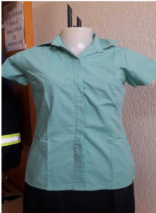
Figura 2 - Item 2