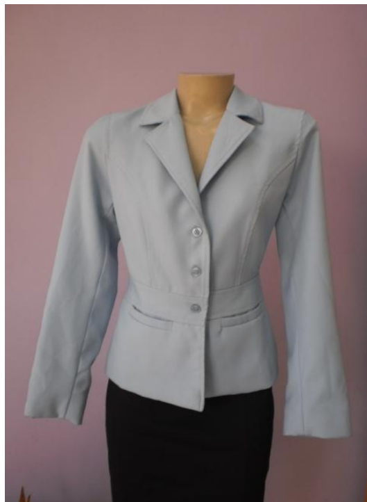
Figura 5 - Item 5