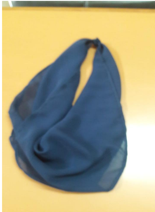
Figura 4 - Item 4