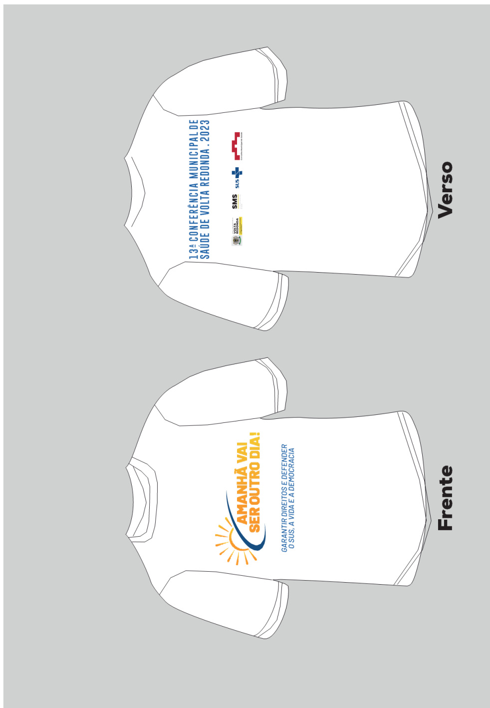
Figura 1 - Item 1