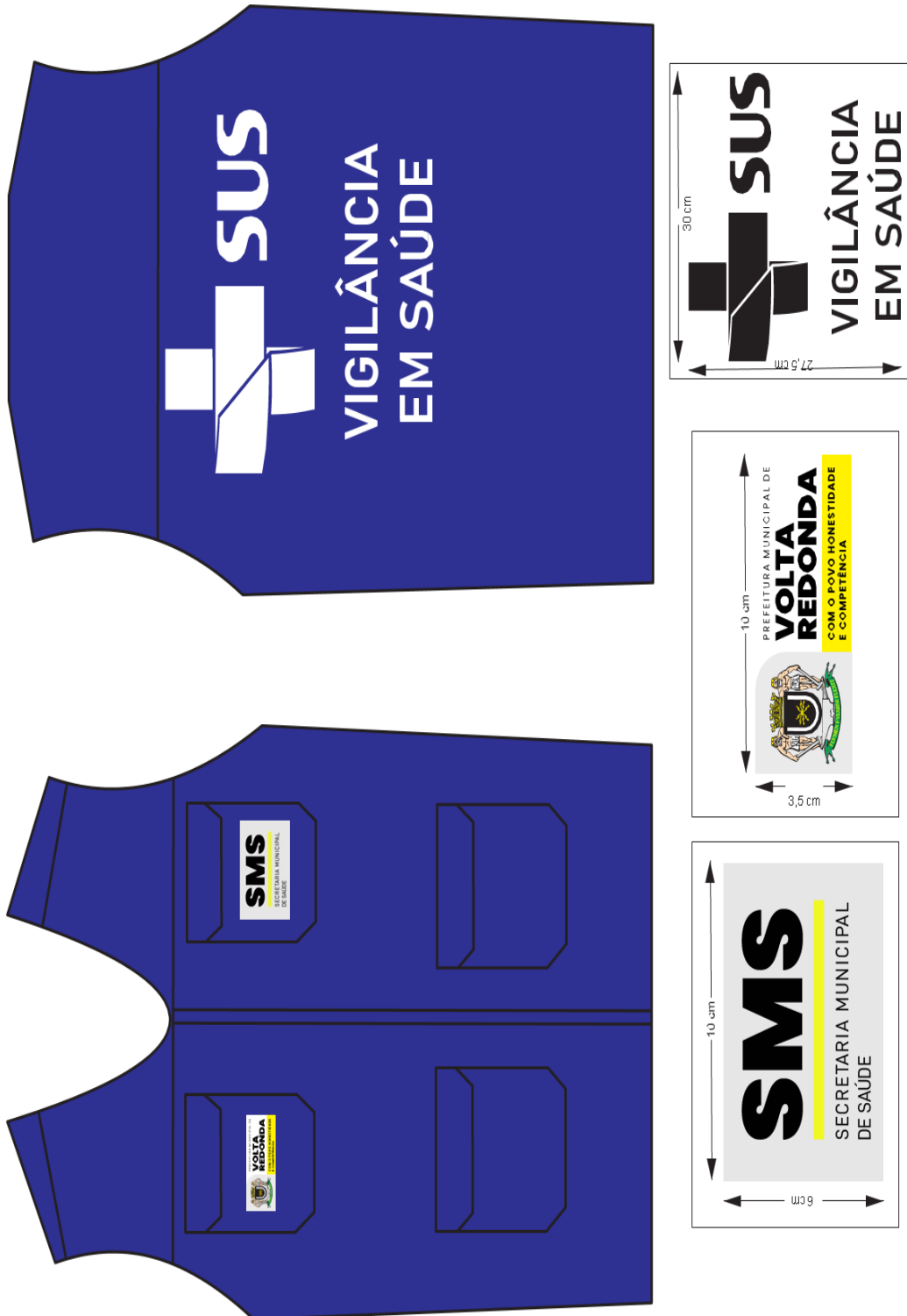
Figura 7 - Item 7