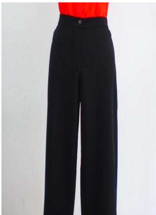
Figura 3 - Item 3