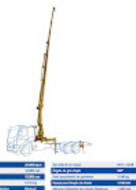
GMR 20.000 4H.jpeg 174K