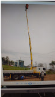
CESTO AÉREO ISOLADO - FOTO MERAENTE ILUSTRATIVA.jpeg 76K