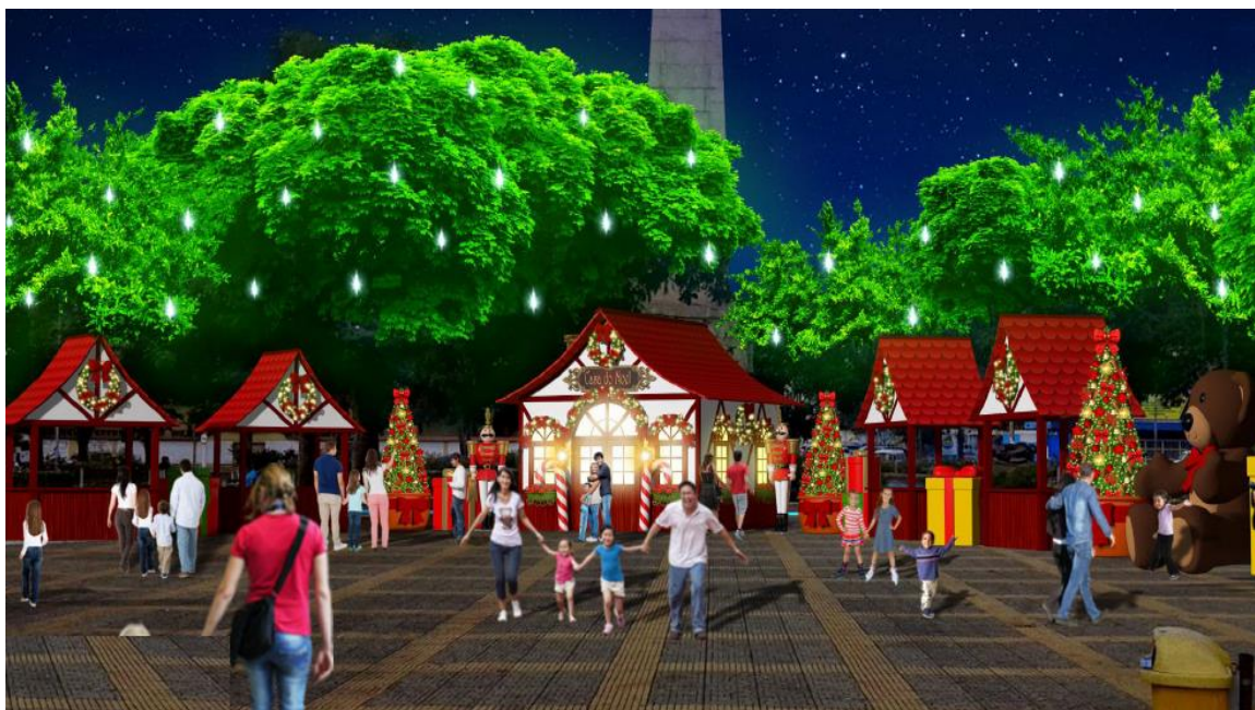
*Imagem Praça Brasil Decorada.

Imagem meramente ilustrativa, não representando na integralidade o projeto Natal do Bem.